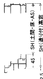
【テラス障子・造り付 SH】